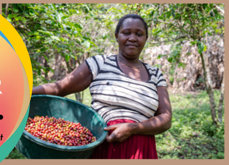
Kaffeeanbau & Ernte bei Bocu in Uganda