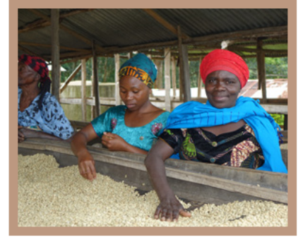
Trocknung & Weiterverarbeitung