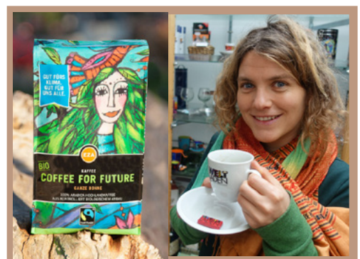
Kaffeegenuss im Weltladen