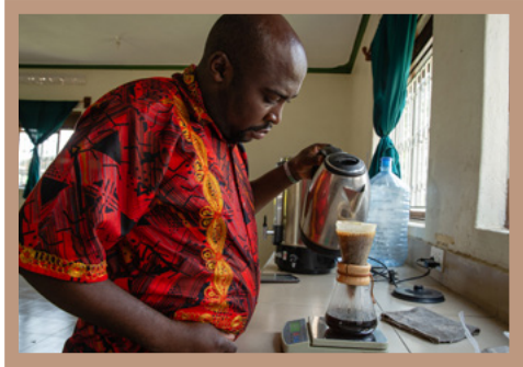
Vom Regionallager zur Zentrale zum Verkosten & exportfähig verpacken