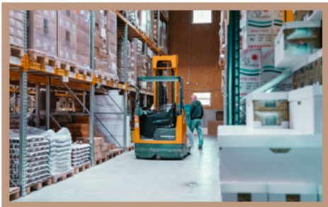
Import durch EZA Fairer Handel