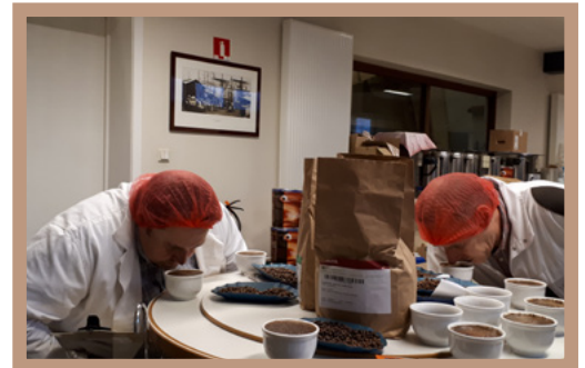
In der Familienrösterei SAS in Belgien wird der Coffee for Future zusammen mit den Bohnen aus Mexiko geröstet.